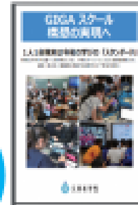
GIGAスクール構想の実現へ(リーフレット)

学習者用の1人1台端末と、高速通信ネットワークを一体的に整備することで、多様な子供たちそれぞれに最適な学びを実現するために、国が進める教育政策です。